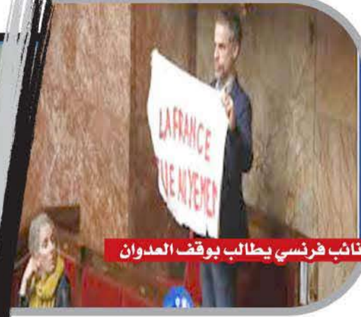
نائب فرنسي يطالب بوقف العدوان