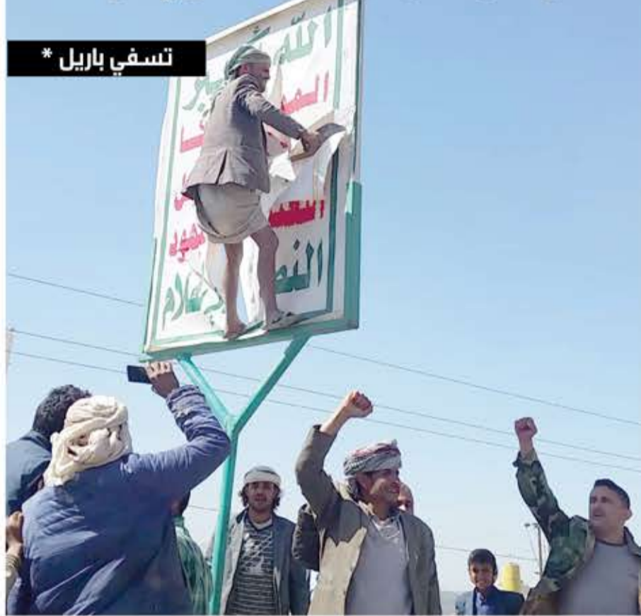
تسفي باريل *

الاستخباراتي لا يزال مسموحاً به). هذا قرار تفسيري يقصد به أن ينقل إلى الرئيس دونالد ترامب وولي العهد السعودي أن الولايات المتحدة لم تعد تدعم هذه الحرب، التي خلقت واحدة من أعظم المآسي الإنسانية، على الرغم من وصفها بأنها صراع ضد إيران. ليس لدى الولايات المتحدة أي قوات عسكرية ناشطة في الحرب في اليمن، لكن "جيش" من المرتزقة، والذي يضم العديد من الأمريكيين، قد يستمر في العمل دون عوائق طالما تم تمويله من قبل الدول العربية.