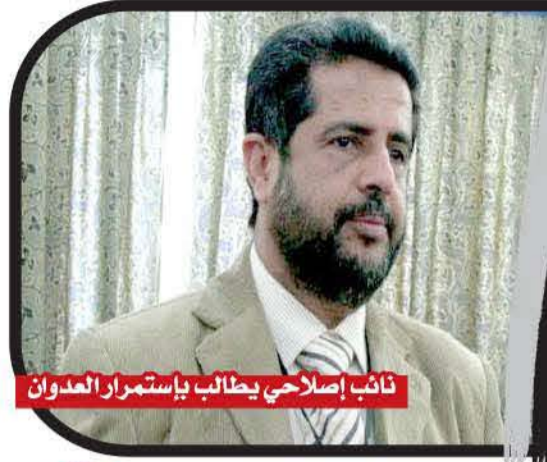
نائب إصلاحي يطالب باستمرار العدوان