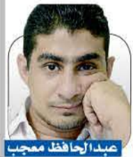
عبد الجافل معجب

المراهق معمر الإرياني، المشغول بالتغريد على "تويتر"، لا وقت لديه لأن يقرأ أن وزير الخارجية الأمريكي مايك بومبيو صرح قبل مشاورات السويد أنه حان وقت وقف العدائيات بما في ذلك إطلاق الصواريخ والهجمات بطائرات بدون طيار من مناطق تخضع لسيطرة المجلس السياسي الأعلى وحكومة الإنقاذ ضد السعودية والإمارات، وقال إن الهجمات الجوية للتحالف يجب أن تتوقف في جميع المناطق المأهولة في اليمن.