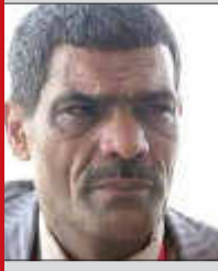
يحيى نوري كاتب ومحلل سياسي