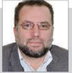
جهد سعد *

من الأطباء النساء والرجال والفنيين، إنهم يقومون بدورهم بمهارة في أصعب الظروف في ظل ندرة وصعوبة توفر كوادر أجنبية.