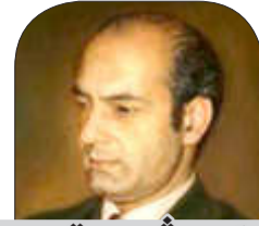
د. علي شريعتي