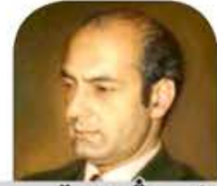
د. علي شريعتي

بسبب انبهارها وانجرارها وراء الغرب الاستعماري، ثقافياً وسياسياً على وجه الخصوص، فإن المنطقة العربية ما تزال شبه مغيبة عن الاطلاع على الارث والأثر الفكري والعملي للدكتور الشهيد علي شريعتي، رغم شهرة الواسعة، ورغم حاجتها إليه.