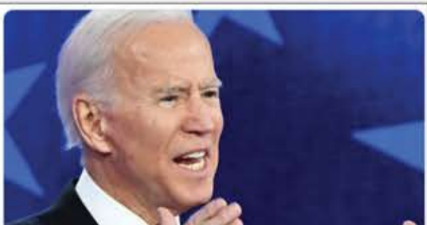
Joe Biden, In Departure from Obama Policy, Says He Would Make Saudi Arabia ... Biden also made some blunders during Wednesday's Democratic debate, including saying we have to keep "punching at" domestic violence.