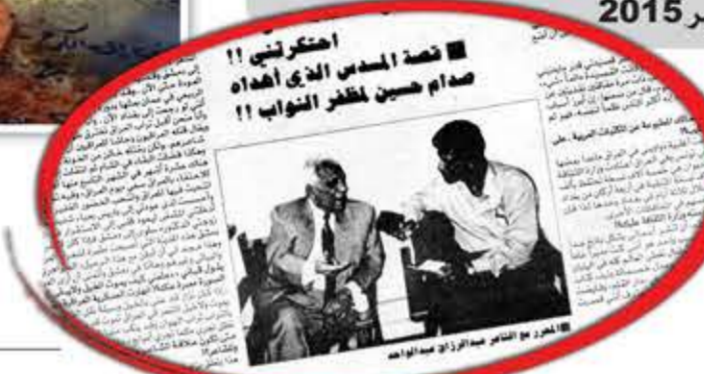
احتكرتني!! قصيدة المدي الذي أهدها صدام حسين لظفر الثوب !!

الذي قلت فيه: أتجول في شوارع باريس في وقت متأخر من الليل، وكان بصحبتني الفنان الراحل كرم مطاوع، كنت خارجاً من نوبة ليلية، وكنت أردد معه بصوت مرتفع القصيدة التالية: يا عبدالرزاق ميلادك في موتك يا عبدالرزاق، ميلادك في موتك موتك في صوتك فتأمل، فكل الفجعة في الصوت هذا بكاء ولدنا وبكاء لنموت فمتى نتعلم أن السكوت أبلغ الأبتين؟! وقال فاروق شوشة يوماً بعد أن سماع بالقصيدة: «سخرج عبدالرزاق من المشفى محمولاً على الحديد»، لكن شيئاً من ذلك لم يحدث، فأنا كنت ممن يُسمع صوتهم ويحترمون لدى النظام. ■ ما الذي يجبر «النظام» على احترامك مع كل ما تقول؟ - أنا كنت كما سماني رئيس الدولة «صوت الوطن العربي»، كان صوتي هو صوت العراق سياسياً ووطنياً، على أنني أكره السياسة بطبيعتي. ■ ماذا خسرتك عبدالرزاق الشاعر والإنسان باحتلال العراق وسقوط النظام الحاكم فيه؟ - إذا سمعت بإنسان يموت إن خرج من وطنه كما توت السمكة إن خرجت من الماء، فذلك الإنسان هو أنا، لهذا السبب أصبت بالنوبة القلبية جزعاً على العراق وجزعاً عليّ، كانت أقصى مدة أحتمل قضاءها خارج العراق وبعيداً عنه لا تتجاوز الشهر، ولدي عودتي كنت أحسن بأنني أصبحت في العراق حالماً أبذل الطائفة العراقية، فابكي فرحاً، فماذا تتوقع أن يعني احتلال العراق بالنسبة لي؟! ذلك هو جرحي الكبير الذي سيظل ينزف دماً، لكنني أتفق في أن هذا الجرح سيلتئم يوماً ما، لأنني أعرف العراقيين وأنا حينما أتف. ■ هل حدث أن دخلت في مواجهة مع النظام بسبب قصيدة أو موقف ما؟ - سأخبرك بشيء.. ذات يوم كنت