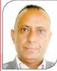
د. م. ه. الحسام

العدوان على الشعب اليمني، وآخر هذه الحماقات أوامره باغتيال قادة المقاومة القائد الحاج قاسم سليمان والحاج أبو مهدي المهندس، وهما من كان لهما الفضل في تطهير العراق من تنظيم داعش الإرهابي، وفوتاً بذلك الفرصة على أمريكا للبقاء الآمن في العراق؛ ناهيك عن إخضاعه والسيطرة عليه ونهب ثرواته كما يشاء. إن هذه العملية الإجرامية التي أقدم ترامب الأحق على ارتكابها الهدف منها إخضاع إيران والعراق معا ومحور المقاومة، فكل التقارير التي كانت ترفع إليه تؤكد أن سليمان هو القائد الذي لا يمكن لمحور المقاومة تعويضه، فأقدم على ارتكاب جريمة اغتيالهما بحماقة دون إدراك عواقب فعلته. هناك مثل شعبي شائع في الشام يقول: "حساب الحقل لا يمكن أن يطابق حساب البيدر"، أي أن ما يحصده الفلاح من سنابل القمح في الحقل بالتأكيد ليس هو صافي غلته بعد إتمام عملية درسه وتنقيته في البيدر، فالفلاح الخبير يعلم تماماً أن صافي غلته هو ما يتبقى بعد تنقية القمح من بقايا القش وغيرها. وترامب بتنفيذه جريمة الاغتيال كان أشبه بفلاح غبي، إذ وجد نفسه عقب الجريمة أمام حقيقة واقعة، وهي أن حسابات بيده تخالف تماماً حسابات حقله، فارتدت سهامه إلى نحسه، وقراره الأرعن ارتد وبالا عليه وعلى أمريكا برمتها وعلى تواجدتها في العراق والمنطقة كلها. وهذا إن دل على شيء فإنما يدل على جهل ترامب بحقائق التاريخ، وغبائه الفج، وعدم امتلاكه لأدنى معايير إدارة السياسات الدولية. لذلك فإن ترامب هو أفضل من يقود أمريكا نحو السقوط بما كسب رهينة.