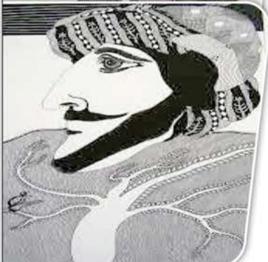
اللوحات للفنان فؤاد الفتيح