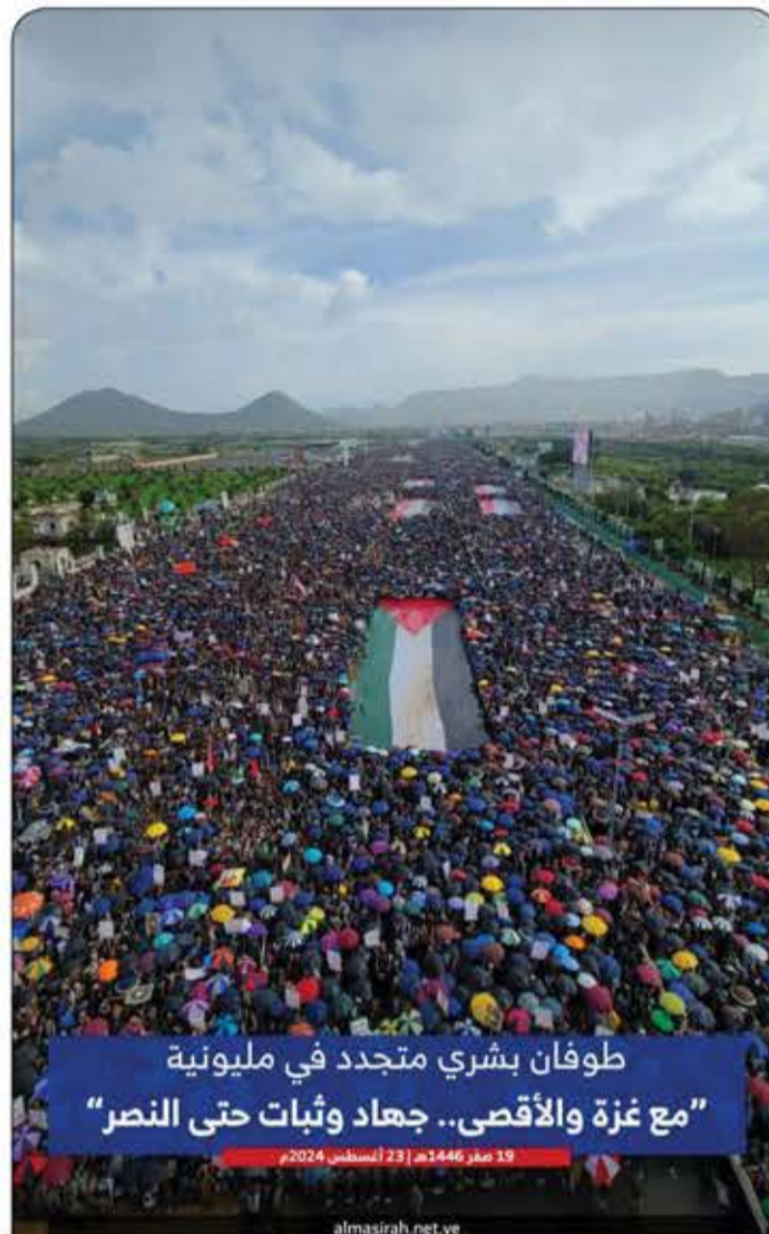
طوفان بشري متجدد في مليونية "مع غزة والأقصى.. جهاد وثبات حتى النصر"