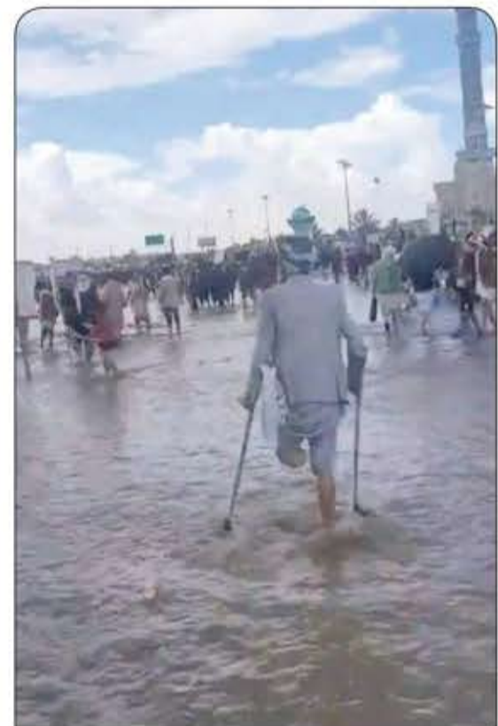
السما تمطر بالماء، وأرض اليمن تنبت بالرجال في اللحظة نفسها.

لم يعد مصطلح «المغرر بهم» مقبولاً أبداً! لا يوجد أحد الآن مغرر به، فمعركة غزة كشفت الحقائق وأزالت الأقنعة وتكشفت النوايا للأعمى والبصير، وكل شيء أصبح واضحاً، وأصبح الصراع القائم بين الحق والباطل أكثر اتضاحاً من أي وقت مضى.