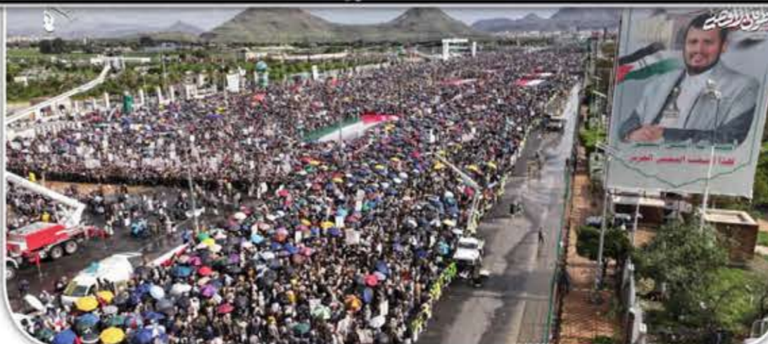
وجرائم الإبادة ضد الفلسطينيين، وطالبت الحشود القيادة الحكيمة ومحور المقاومة باتخاذ كل الخيارات

للرد القوي على جرائم العدو الصهيوني، نصرة لغزة، مباركة استمرار عمليات القوات المسلحة اليمنية ضد العدوان الأمريكي والصهيوني والبريطاني. وأكدت البيانات الصادرة عن المسيرات أن جريمة القرن ما زالت متواصلة في قطاع غزة وكل فلسطين من قبل العدو الصهيوني المجرم للشهر الحادي عشر على التوالي، وبشراكة أمريكية ودعم استخباري أوروبي في عدوانهمجي وإبادة جماعية وحشية لا مثيل لها، في ظل صمت أممي وتخالذ عربي وإسلامي مخز ومشين، مجددة العهد والوعد والوثبات على الموقف الإيماني الراسخ والمبدئي المساند للشعب