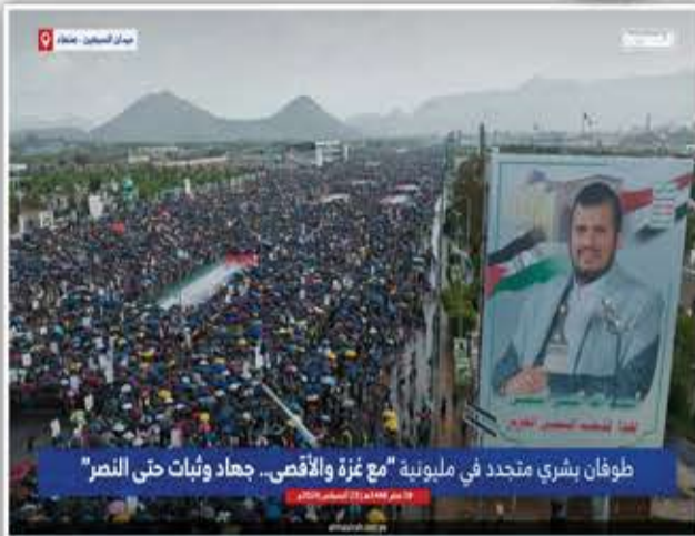
طوفان بشري متجدد في مليونية "مع غزة والأقصى.. جهاد وثبات حتى النصر"

هذا طوفان بشري من الشعب اليمني خرج في صنعاء اليوم (الجمعة) رغم الأمطار الغزيرة والفيضانات، خرج للتعبير عن دعمه المتواصل لغزة ككل أسبوع مهما كانت الظروف. بارك الله فيهم جميعاً، وأنا على قناعة تامة أن اليمني لو كان بجوار فلسطين لكانت الآن محررة، ولكن إنها لعنة الجغرافيا التي وضعت فلسطين بجانب دول تفتح حدودها لتصدير السلع للاحتلال بينما يتواصل خنق وحصار أهالي غزة!