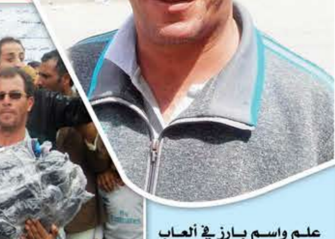
علم واسم بارز في ألعاب القوى داخل الوطن وخارجه. بالإمكان وصفه بـ"أيام الألعاب" في اليمن.