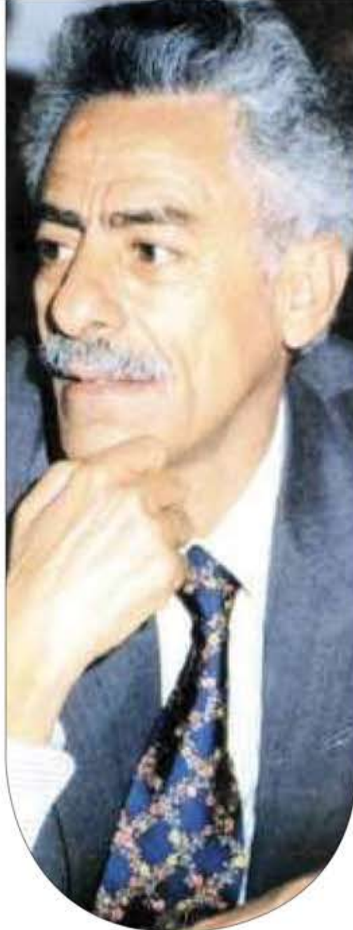
الذي يمثله النازيون.

وذلك خلافاً لأسباب كراهيتهم العرقية لنا معشر السود، والمحكومة أساساً بجملته من الدوافع والتفسيرات الأيديولوجية واللاهوتية المنطلقة من قناعته الراسخة (أي هتلر) بكوننا مخلوقات بربرية غير ملائمة البتة للعيش والانخراط في الحياة الإنسانية، من منطلق أن وجودنا في الأساس كان - وفق تصوراتهم الفلسفية المريضة - أحد أخطاء الرب والمشينة المرتكبة في حق جنسهم البشري المتفوق، ونتاجاً لخلل بنيوي تكويني معيق لسبل النجاح والتطور المفترض للجنس الآري