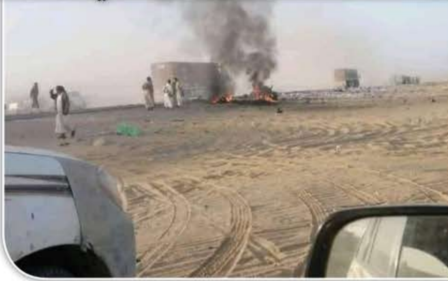
حالة من التوتر ومخاوف من تصاعد المواجهات واتساع نطاقها.

وأشارت المصادر إلى أن المواجهات جاءت نتيجة تعثر جهود احتواء قضية الثأر بين القبيلتين، رغم مرور عدة سنوات على اندلاعها، في حين يتهم الأهالي والوجهاء القبليون سلطات الارتزاق التابعة للخونج بالتواطؤ وعدم التدخل لوقف النزاع، محذرين من تفاقم الأوضاع الأمنية في منطقة وادي عبيدة.