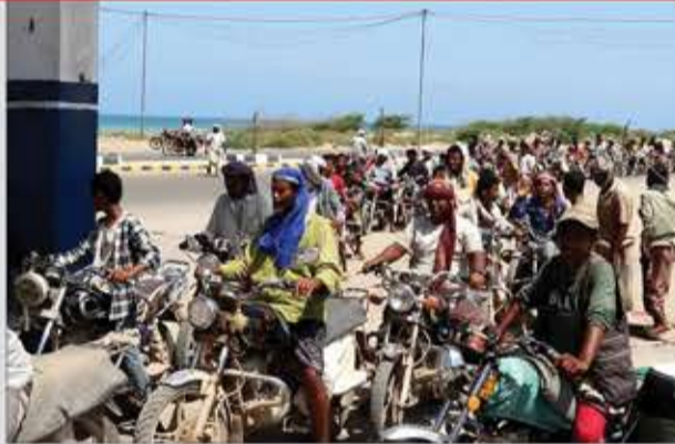
المدينة المحتلة، في حين أرجع ملاك محطات التعبئة الأزمة إلى انخفاض كميات الإمدادات الواسلة إلى المدينة.

وتأتي أزمة الوقود في الخوخة بعد أسابيع من أزمات مماثلة شهدتها عدد من المحافظات المحتلة، عقب الجرة السعرية الأخيرة التي أقرتها حكومة الغنادق.