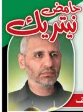
الشهيد القائد محمد الضيف

المقاومة هي الطريق الوحيد لاستعادة الحقوق، فالدو لا يفهم إلا لغة القوة.