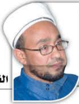
القاضي محمد الباشق

من الناس من لا يسعى لتحمل مسؤوليته تجاه مجتمعه، منكمنا على ملذاته، منشغلاً بحياته الخاصة. ومن الناس من يريد النعمة دون اهتمام بمعرفة من أين وإلى أين!