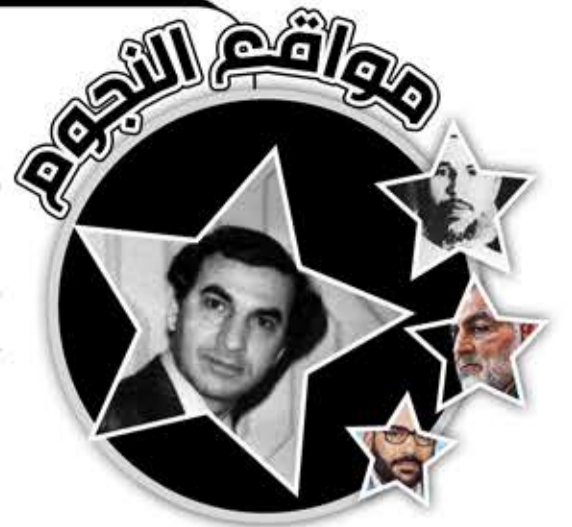
عز الدين القلق

عُرف بأنه من ألمع العقول الدبلوماسية البارزة في الثورة الفلسطينية. استطاع بفضل شخصيته المتميزة وإتقانه اللغتين الفرنسية والإنجليزية أن يخاطب عقول الفرنسيين ولقوبهم لتدعيم النضال الفلسطيني في أشد الساعات الأوروبية ضراوة وقسوة وأكثرها خطورة. بالنظر لوضع فرنسا من جهة وثقل الحركة الصهيونية فيها من جهة ثانية. ولد عز الدين القلق في مدينة حيفا عام 1936. حصل في جامعة دمشق على بكالوريوس رياضيات / فيزياء عام 1963. كتب القصة القصيرة وهو في الـ20 من عمره، ونشرت قصصه آنذاك في الصحف السورية. عام 1963 سافر إلى السعودية وعمل مدرساً مدة سنتين، ثم انتقل إلى فرنسا عام 1965. عام 1966 حصل على «أهلية تعليم اللغة الفرنسية». ثم نال الدكتوراه في الكيمياء الفيزيائية عام 1969. حمل قضيته وأخذ يشرحها بشكل مدروس للمحيطين به، فأقام الندوات في المدن الفرنسية المختلفة، مما لفت إليه أنظار الصهاينة، الذين استشعروا الخطر فحاولوا اغتياله عدة مرات. بعد اغتيال أول ممثل لمنظمة التحرير في باريس عام 1973 اختير