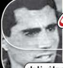
الشهيد المصري سليمان خاطر بطلة سيناء

لا أرهب الموت، ولكن أخشى أن يقتل الحكم الصادر ضدي وطنية المصريين.