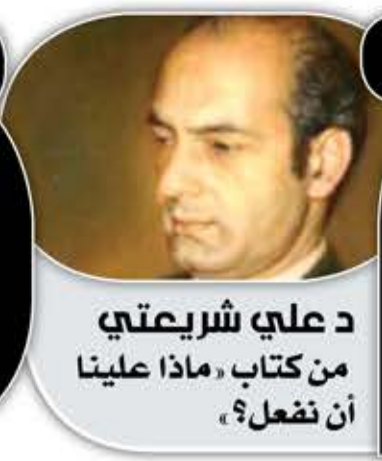
د علي شريعتي من كتاب «ماذا علينا أن نفعل؟»

صه! «إذا أردت أن تعرف من الذي يتحكم بحياتك، فحاول اكتشاف الجهة التي لا تسمح لنفسك بانتقادها.»