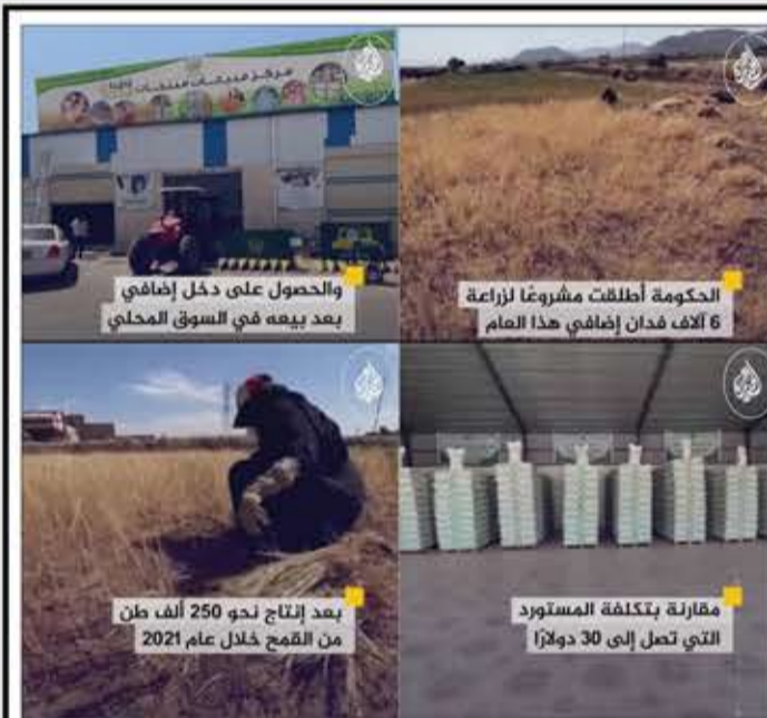
الحكومة أطلقت مشروعاً لزراعة 6 آلاف فدان إضافي هذا العام والحصول على دخل إضافي بعد بيعه في السوق المحلي مقارنة بتكلفة المستورد التي تصل إلى 30 دولاراً بعد إنتاج نحو 250 ألف طن من القمح خلال عام 2021

مرقدنا إذا حدا بعده ما ضحك اليوم، قلت بسليكم: قال تحترم ولا تتدخل وتلتزم...! سبحان مغير الأحوال، ومبدل التغريدات! #هيفاء_وهبي_في_السعودية حسين مرتضى Waleed A. Bukhari @bukhariwaleed المملكة العربية السعودية تثبت دومًا رغم كل محاولات التحريض والتشويه لدورها الإيجابي، مدى التزامها بدعم لبنان واحترام سيادته وعدم التدخل في شؤونه الداخلية.