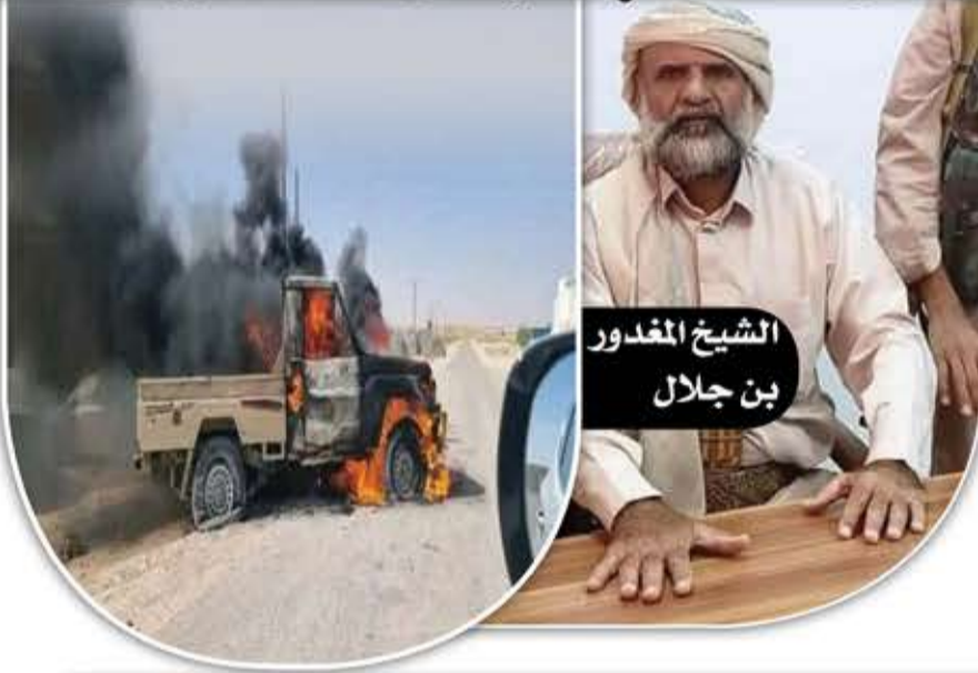
الشيخ المغدور بن جلال

أمس وتسببت في انقطاع تام للتيار الكهربائي عن مدينة مأرب وتوقف حركة السير في الخط الدولي ونزوح عشرات الأسر من منازلهم. وأشار إلى أن الخونج شنوا قصفاً مدفعياً مكثفاً على منازل المواطنين ومزارعهم في منطقة الدماشقة وحاولوا اقتحام المنطقة غير أن صمود المواطنين ومقاومتهم أجبرت المليشيات على التراجع. وأكد المصدر أن الاشتباكات اندلعت على خلفية استحداث القيادي في المرتزقة المدعو سعيد بن معيلي معسكراً تدريبياً في منطقة الدماشقة أحد فروع قبيلة عبيدة، ما قوبل برفض أبناء القبيلة ودفع المليشيات الموالية للعدوان لمحاولة اقتحام المنطقة بالقوة وترويع الأمنين.