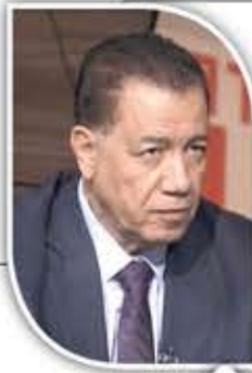
أحمد عز الدين كاتب مصري

إن أبعاد صورة الإمارات الراهنة في اليمن، بعد أن انخرطت في الحرب عليها، بدعوى دعم السعودية، ناطقة بالطبيعة الخاصة لدورها في الإقليم، شراء للذمم، واستنجاراً للمرتزقة من الداخل والخارج، بمن في ذلك كتائب "القاعدة"، وألوية السلفيين، نشراً للفوضى وإيقاظاً للتناقضات، واقتطاعاً للمواقع الحاكمة في الجغرافيا الاستراتيجية، واستلاباً للشعور وبواطن الثروات، واستعباداً لأصحاب الأرض.