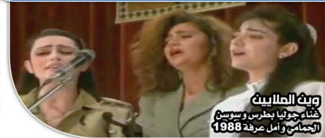
ويث الملايين حناء جوليا بطرس وسوسن الرحباني وأمل عرفة 1988

النضالية الداعمة لفلسطين والمحدرة من خطر الصهيونية. منذ عقود بدأت حرب حقيقية من الفلسطينيين على الأغنية العربية الداعمة المطبوعة وحتى غير المطبوعة لتغيب الأغنية العربية الداعمة لفلسطين، وحتى وضع معايير منصات الإنترنت والتواصل الاجتماعي التي تدعم الكيان الصهيوني وتصف كل ما يقاوم ظلمه وإجرامه بالمحتوى “الإرهابي”.