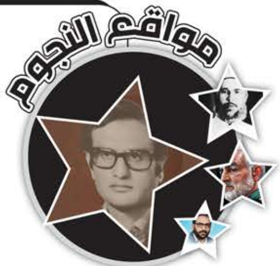
رشاد عبد الحافظ

شرار، حيث شغل مدير تحرير «فلسطين الثورة» الصحيفة المركزية الناطقة باسم منظمة التحرير الفلسطينية. بعد استشهاد ماجد أبو شرار صار مسؤولاً عن مجلس الإعلام الفلسطيني الموحد. على صفحات «فلسطين الثورة»، وفي الطيونة، وفي الشياح، سجل عنوان ثورته الجذرية الناضجة. كان عميق الإيمان بوحدة الكلمة والرصاصة، فكتب في «فلسطين الثورة» أروع عطائه الثوري في خدمة قضية الثورة والشعب (بالدم قاتل من أجل فلسطين... وبالدم كتب لفلسطين). ويعرف بلقب «شهيد الإعلام الفلسطيني الموحد». خلال الحرب الأهلية في لبنان شارك إخوانه المقاتلين الدفاع عن الثورة ووجودها في وجه المؤامرة التي نسج خيوطها أعداء الثورة وحلفاؤهم التقليديون. اغتاله الكيان الصهيوني في 24 نيسان/ أبريل عام 1967 بطلقة نارية بين عينيه من قنص صهيوني في منطقة الطيونة «محور حي الشياح - عين الرمانة» في ضواحي بيروت وهو يشارك في المعركة.