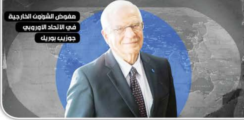
مفاوض الشؤون الخارجية في الاتحاد الأوروبي جوزيب بوريل

وفي مقابل العشماوي المصري، عرفت أوروبا عائلات متخصصة بقطع الرؤوس من أشهرها، عائلة سانسون الفرنسية التي توارثت هذه "المهنة الديمقراطية" كما توارثت أوروبا وواشنطن وجمهوريات إسكندنافيا جينات القتل، وأخرها دعم النازية في أوكرانيا.