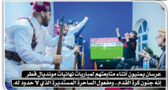
عرسان يمتيون أثناء متابعتهم لمباريات نهائيات مونديال قطر إنه جنون كرة القدم.. ومفعول الساحرة المستديرة الذي لا حدود له.