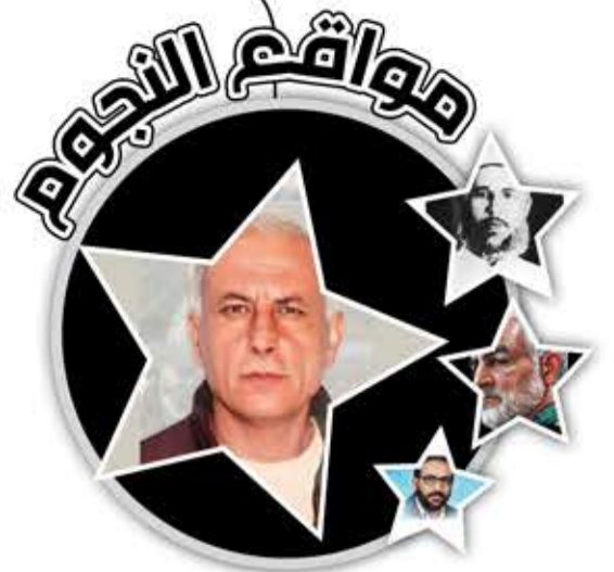
كريم يونس (عميد الأسرى الفلسطينيين)

«لقد قاتلنا وضحينا من أجل بلدنا وكرامتنا، وسنبقى نقاتل من جوف زنازيننا وما بقي لنا من العمر. إن السجن لم يسيطر علينا، والسجان الذي يقيد أيدينا تحول إلى سجين في حياتنا. وسيبقى مستنفراً وقلقاً تحت وقع مقاومتنا وإصرارنا على الحرية» (كريم).