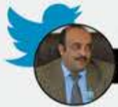
القاضي رشيد مامون الشامي

ما أضعفه من تحالف! بدأ بعاصفة «حزم جرارة»، ثم انتقل لـ«شرعية هادي»، ثم حاول بانقضاة «صالح»، ثم عاد إصدار «الشرعية» بنسخة «مجالس القيادة»، وبعد فشله في تحقيق أي نتيجة، سخر إمكانياته الإعلامية لمجموعة من الكوميديين «الزباجين» وسماها «ثورة الجياع» في يوم 30 ديسمبر التي لم يخرج فيها أحد!