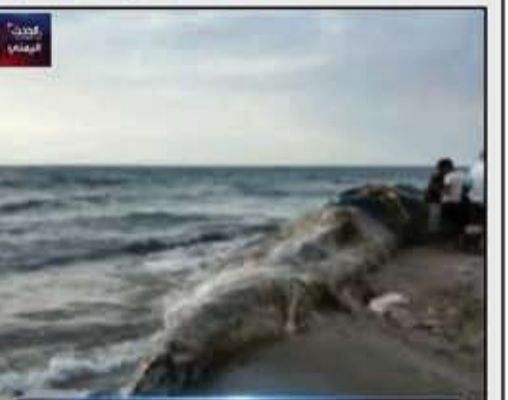
البحر يلفظ حوتا ضخماً يرجع نفوقه بلغم بحري حوثي