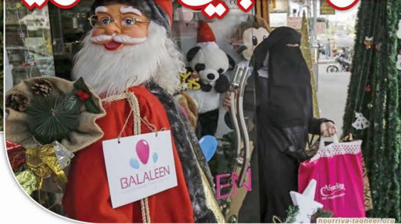
بمناسبة عيد الميلاد، وأوضح أن هذا الاحتفال هو الأول من نوعه في السعودية، «أن تأتي متأخراً خير من ألا تأتي».

الصحيفة، فيصل عباس، عنوان «ميلاد مجيد من عرب نيوز»، وقال فيه إن الصحيفة تتقدم بالتهنئة لكافة المسيحيين في المملكة السعودية وخارجها