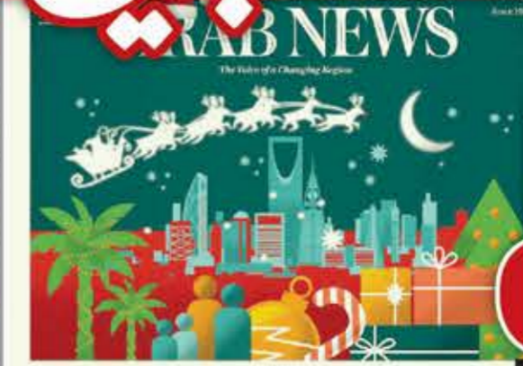
Saudis feel Xmas spirit like never before

الصحيفة، فيصل عباس، عنوان «ميلاد مجيد من عرب نيوز»، وقال فيه إن الصحيفة تتقدم بالتهنئة لكافة المسيحيين في المملكة السعودية وخارجها