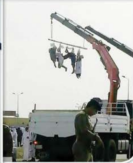
حيث سبق أن تم إعدام الكثير من المغتربين اليمنيين في ظروف مماثلة.

غير منصفة وغير علنية، وغاب عنها أي تمكين للضحايا من الدفاع عن أنفسهم.