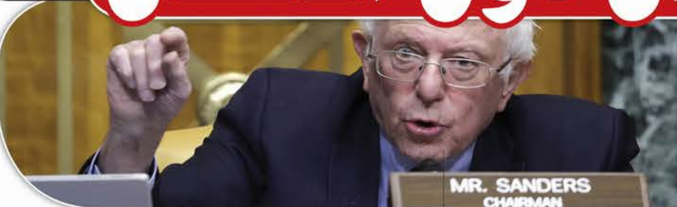
MR. SANDERS CHAIRMAN

عندما دعا السيناتور بيرني ساندرز للتصويت على قرار صلاحيات الحرب الذي من شأنه أن يحظر الدعم الأمريكي للجهود الحربية التي تقودها السعودية في اليمن؛ تراجعت إدارة بايدن على الفور، وحذر البيت الأبيض من أن القرار سيقوض الجهود الدبلوماسية ويؤدي إلى الحرب التي كان يحاول إنهاءها.