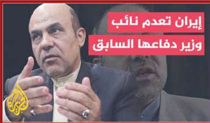
إيران تعدم نائب وزير دفاعها السابق

بالأمس أعدمت إيران نائب وزير دفاعها السابق: بعد ثبوت تورطه بجرم الخيانة والتخابر مع دول العدو . وعندنا ما قد أعدموا نبي رفعوا الإحداثيات وفخخوا السيارات ، واغتالوا أهم وأكبر وأنقى قياداتنا ، ولم يتم معاقبة أحد ، بمن فيهم من صدرت بحقهم أحكام بآلة ونهائية ، ونستغرب لماذا تتزايد الخلايا التابعة للعدوان!