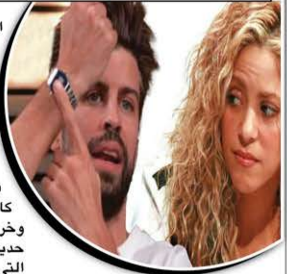
رد نجم برشلونة السابق جيرارد بيكيه، بطريقته الخاصة، على

الأغنية التي أطلقتها شاكيرا، وحملت تلميحات "تهكمية" عليه بأنه "استبدل ساعة روليكس بساعة كاسيو، واستبدل الفيراري بسيارة رينو". وظهر بيكيه، أمس الأول، بسيارة رينو من طراز (Twingo) كتلك التي تحدثت عنها شاكيرا في الأغنية الخاصة بها التي كانت مكرسة للهجوم عليه. وخرج بيكيه في فيديو قبلها، مستغلا حديثه عن بطولة "كينغس ليغ" التي يرأسها، حيث قال: "لقد أرسلت لنا كاسيو ساعات جديدة"، مضيفا: "لقد توصلنا إلى اتفاق رعاية بين البطولة وشركة كاسيو"، وسط