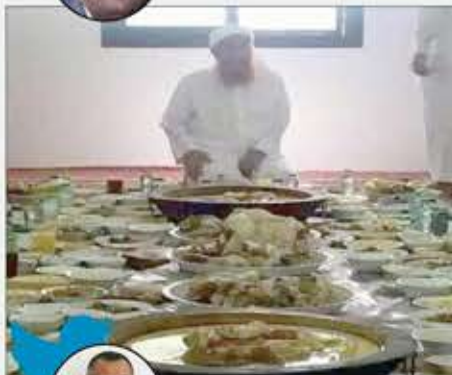
الشيخ الزنداني منهمكاً في شرح سورة «المائدة»!