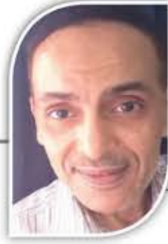
إيهاب شوقي كاتب مصري