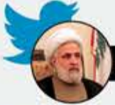
الشيخ نعيم قاسم

مقاومة جنين هي المستقبل، ودماء الشهداء زرع للحرية. ولأن فلسطين بوصلة الحق فشعبها ومجاهدوها منصورون، وسيسقط الصهاينة حتى لو اجتمع معهم الظالمون والمستكبرون في العالم. الدم ينتصر على السيف.