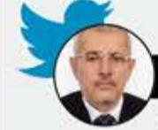
الشيخ حسين حازب

سؤال للنظام السعودي الذي اعتقل وأخاف اللبوة اليمنية الأصلية، مروة الصبري: هل كذبت عندما قالت كلمة من مليارات الكلمات التي سجلها التاريخ عن تدميركم لليمن منذ أوصاكم كبيركم بأن شركم في استقرار اليمن وخيركم في دمارها؟! وهل سجنها سينفي حقيقة تدميركم لليمن من عقل وذاكرة كل يمني؟! كل يمني!