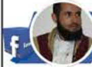
مروان عبده الجماعي

بنات في الحرم بدون عباية هذه الصورة ليست في مرقص من مرقص مصر، ولا في فندق من فنادق قبرص، ولا في صيف جدة... هذه الصورة الفاضحة في المسجد النبوي الشريف في عهد ابن سلمان ودينه الجديد الدخيل، وفي ظل صمت عجيب من قبل رموز الوهابية! لا قداسة ولا احترام للمقدسات. طالما وولي أمرهم على اطلاع، فكل شيء جائز، فقد اعتنقوا العهر والسفور والسفه والانحلال عن قناعة! وحسبنا الله ونعم الوكيل عليهم!