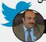
القاضي رشيد مأمون الشامي

تجسيدا لروح الأخوة والمحبة، من أمام السفارة السورية بصنعاء، ومن وسط معاناة الحصار نقول للشعب السوري: لولا الحصار والحرب لوجدتم كل اليمنيين يتسابقون للوصول إليكم ليكونوا بلسما لجراحكم. ونقول لأنظمة النفاق: سارعوا بمد العون، يكفي جبناً، ف«قيصر» ليس إلهاً أو كتاباً مقدساً، إنه جريمة بحق الإنسانية.