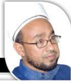
القاضي محمد الباشق