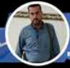
أبو محمد المنصور

نحن نقاتل أغبياء ومتعجرفين. لا يمنحنا الغباء والتعجرف الحق في القضاء عليهم، إلا أنهم يريدون القضاء علينا، فهل نسكت؟! إذا أخبروكم بأي شيء خلاف هذا، فلا تصدقوهم، اطلبوا منهم أن يطلقوا سراح عبد ربه منصور هادي، الذي زعموا ذات يوم أنه استغاث بهم، كيف استغاث بهم ليسجنوه؟! هذا مثال على غيائهم وعلى تعجرفهم أيضاً. نسأل الله أن يكون في عون مفاوضينا، وأن يساعدهم على تحمل غباء وتعجرف الطرف الآخر.