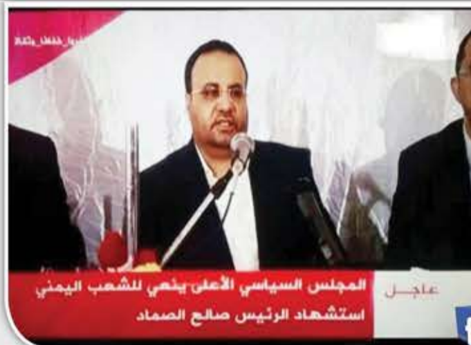
المجلس السياسي الأعلى ينعى للشعب اليمني استشهاد الرئيس صالح الصماد