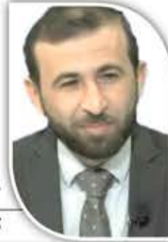
خليل نصرالله كاتب وإعلامي لبناني