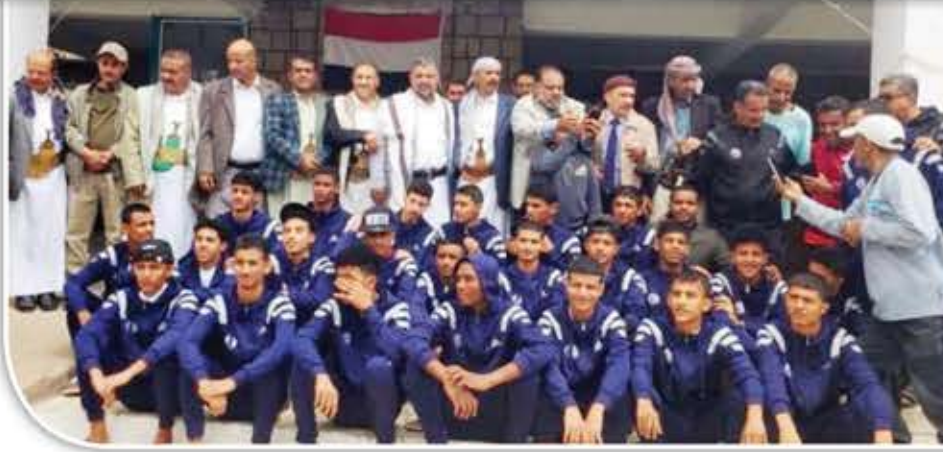
الإيجابية في النهائيات الآسيوية، وعبر عن الأمل في تحقيق النتائج لتشريف الوطن ورفع شأنه عالياً المبدعين.

في المحافل الدولية. بدوره حيا رئيس اللجنة الأولمبية اليمنية اللاعبين والجهازين الفني والإداري، مشيداً بما يقدم من دعم ومساندة ورعاية واهتمام بمنتخب الناشئين. وقال: "نحن في اللجنة الأولمبية نشعر بالاعتزاز تجاه ما قدمه منتخب الناشئين في مشاركته السابقة، ونتطلع لمزيد من الإنجازات في الاستحقاقات القادمة، وجاهزون لتقديم ما يتطلبه المنتخب".