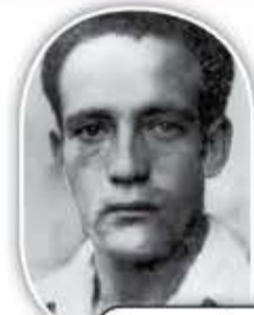
الثائر الجزائري الشهيد محمد العربي بن مهدي

لمزيد من المعلومات أرسل "الرابع" إلى 211 مجاناً