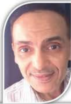
إيهاب شوقي كاتب مصري