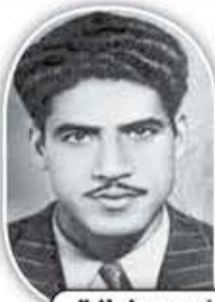
الثور الجزائري الشهيد احمد زبانه

لمزيد من المعلومات أرسل "الرابع" إلى 211 مجاناً