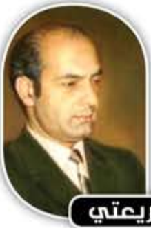
د. علي شريعتي

لمزيد من المعلومات أرسل "الرابع" إلى 211 مجاناً