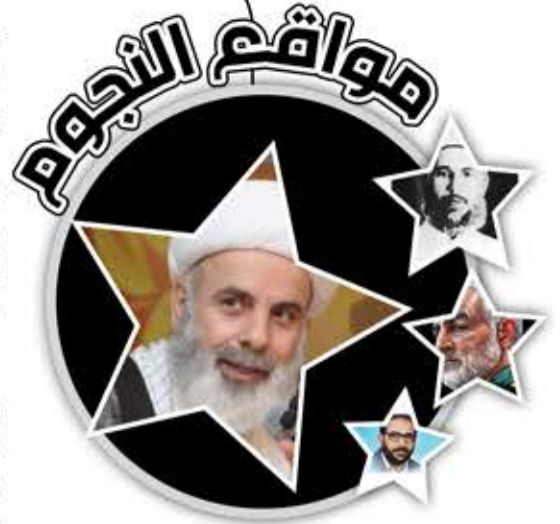
الشيخ عبدالكريم عبيد

ولد الشيخ عبدالكريم عبيد في بلدة جبشيت الجنوبية عام 1957، درس الهندسة المعمارية مدة 3 سنوات في كلية الفنون الجميلة في الجامعة اللبنانية، وعمل خلالها في أحد المكاتب الهندسية. عام 1979 قصد مدينة قم في الجمهورية الإسلامية الإيرانية، والتحق بالحوزة العلمية الدينية. عاد إلى بلده عام 1983 بعدما اعتقلت قوات الاحتلال إمام البلدة الشيخ راغب حرب، فقاد الاعتصام في البلدة لمدة 17 يوماً مما أدى في النهاية إلى الإفراج عن الشيخ راغب. تولى إمامة البلدة عام 1984 بعد اغتيال الشيخ راغب، فواظب على إعطاء الدروس الدينية، وقاد حركة الرفض والاعتصامات متحدياً سياسة القبضة الحديدية التي انتهجها الاحتلال آنذاك حتى الانسحاب الصهيوني منها عام 1985. اعتقلته قوات الاحتلال عام 1984 مرتين، وتعرض منزله لمدهامات عدة من قبل العدو. كما ألقى عملاء الاحتلال عبوة ناسفة على منزله قبل الانسحاب