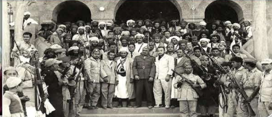
ولفتت المصادر إلى أن «الرؤية