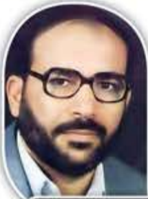
الشهيد القائد فتحي الشقاقي