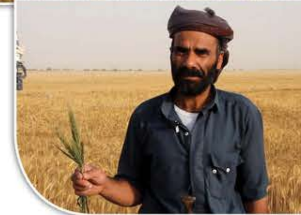
محصولهم حصّده الرياح».

وناشد الأغربي الجهات المعنية في حكومة الإنقاذ أن تولي المزارعين الاهتمام المناسب، موضحاً بالقول: «المزارع يحتاج من الدولة أن تعينه بالبذور المحسّنة والأسمدة، وآلة الحصّاد، وتسويق المحصول، حتى يستطيع أن يستمر في الزراعة ويتوسع في المساحات الزراعية وتحقق الاكتفاء الذاتي».