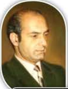
د. علي شريعتي