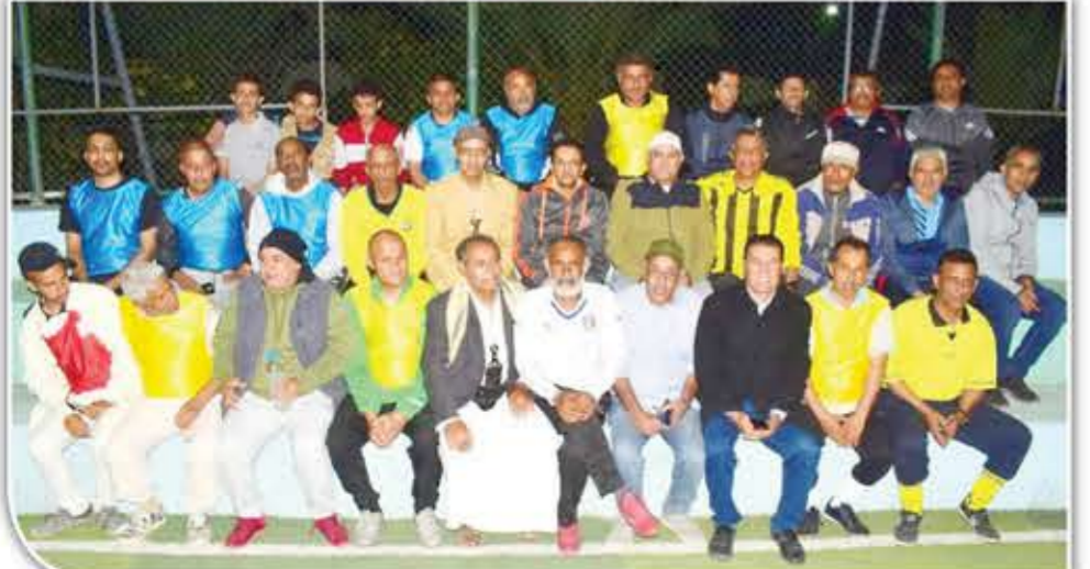
اللاعبون في فريق شباب المجد