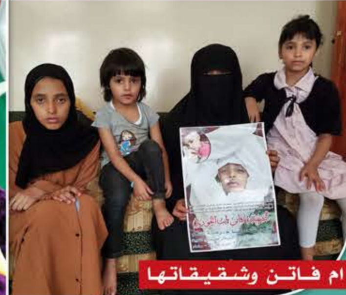
ام فاتن وشقيقاتها

الأدوية وأوجاع المرضى حتى تأتي لتتنبش أوجاعي؟» شخصت إليه وهلة، لا أنطق ولا أطرف. سمعت نفسي تقول لي بصوت لا يسمعه أحد غيري: «لقد وقعت في الفخ! أن أن تعترف».