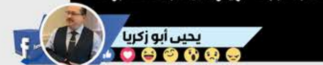
يحيى أبو زكريا