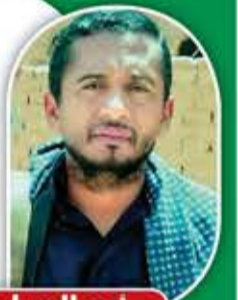
أبو العباس مفلح