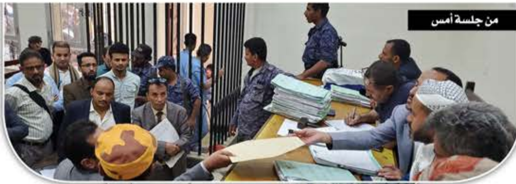
من جلسة أمس

واختتم الأب المكلوم حديثه لـ«لا» بالقول: «كنا أملين أن يتحرك المسؤولون وينقلوا أطفالنا ضحايا الجرعة الملوثة، للعلاج في الخارج ويجبروا بخاطرنا، لكن نقول لهم الله المستعان، ولو أن أحداً من أطفالهم بين المصابين أو المتوفين، لكانوا قلبوا الدنيا، لكننا مواطنون مستضعفون».