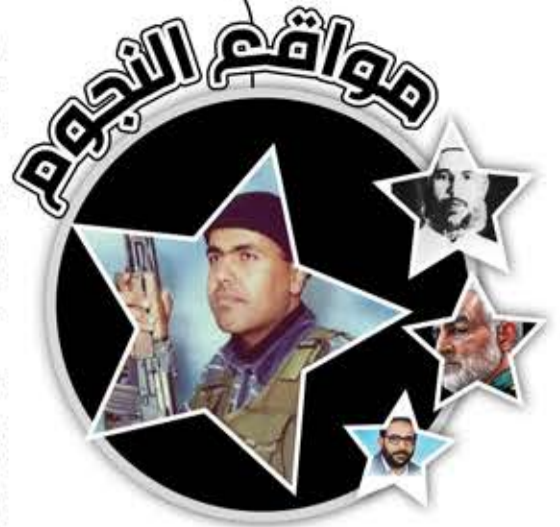
عمرو أبو ستة

لو تعارض ذلك مع منهج حركة «فتح». نفذت العديد من العمليات في خانيونس، ورفض عناصرها إلقاء سلاحهم حتى بعد عودة السلطة وانضمام بعضهم لأجهزتها الأمنية. ومع انتفاضة الأقصى أصبحت أكثر تنظيماً وتسليحاً وفاعلية في أدائها المقاوم. أخفقت أجهزة الاحتلال على مدى 15 عاماً في الوصول إليه، وجعلته دائماً ذريعة لوقف التفاوض مع السلطة والضغط عليها لاعتقاله، وحين اعتقلته السلطة عام 1996، اقتحم عدد من رفاقه السجن الذي كان فيه بغزة، وأفرجوا عنه، ليصبح مطارداً للسلطة الفلسطينية وسلطة الاحتلال معاً. شارك أكثر من 50 ألف فلسطيني في تشييع جثمانه ومساعدته بعد استشهادهما في 29 تموز/ يوليو 2004، بصاروخ استهدف سيارتهما في رفح. وتوعدت كتائب أبو الريش العدو برد موجع ومزلزل على اغتيال قائدها ومؤسسها عمرو أبو ستة، الذي كان قد ولد عام 1972، في مخيم خانيونس. علق رئيس الوزراء الصهيوني، الإرهابي أرئيل شارون، على اغتياله بالقول: «إننا نسعى وراءه منذ سنوات بوصفه مرتكب أشد عمليات القتل وحشية».