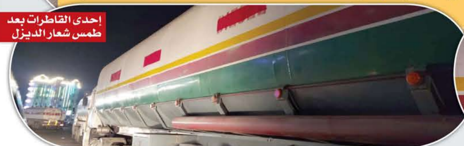
إحدى القاطرات بعد طمس شعار الديزل

مصادر لا: لم يتم اتخاذ أي إجراء ضد المتورطين