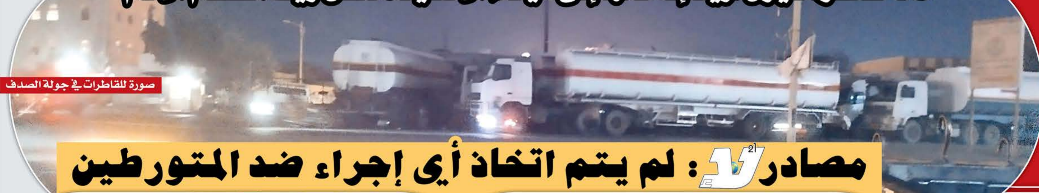
صورة للقاطرات في جولة الصدف

15 قاطرة ديزل أريد إدخالها إلى ميناء الحديد لنقل زيت الطعام الخام